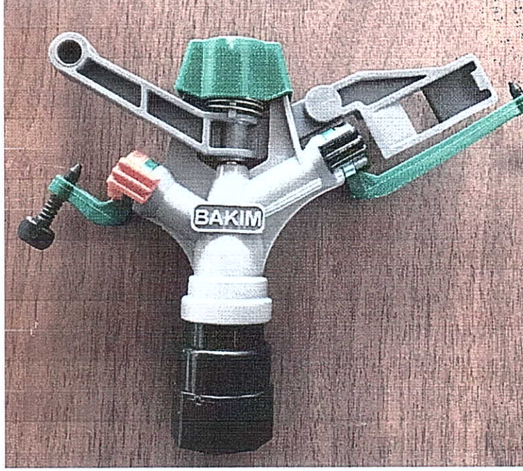
BAKIM PLASTİK Çift Memeli Döner Yağmurlama Başlığı (B-42)